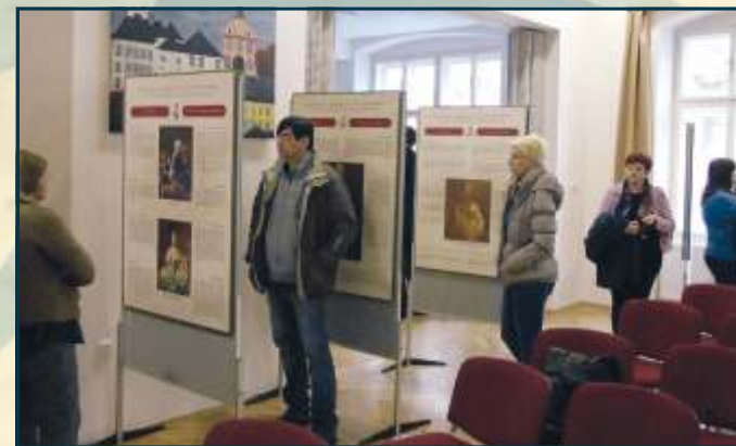
Tematické muzejní výstavy